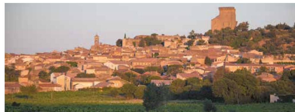
Challenge International des Clubs Oenophiles (CICO) Château de Châteauneuf-du-Pape Dimanche 1 er juillet 2018