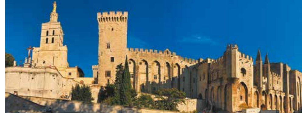
Colloque au Palais des Papes - Avignon Samedi 30 juin 2018

Contact Journées Internationales : Éva Goutorbe eva@chateauneuf.com